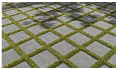
Structure des stationnements